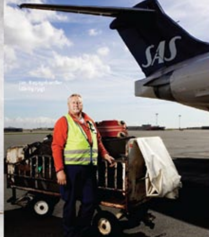
Tom, Flyveplads (Lufthavn)

Udnyt potentialet Tilmeld din virksomhed på potentialet.dk