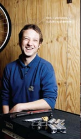
Per, Carlsberg (Lubrikationscenter)

Udnyt potentialet Tilmeld din virksomhed på potentialet.dk