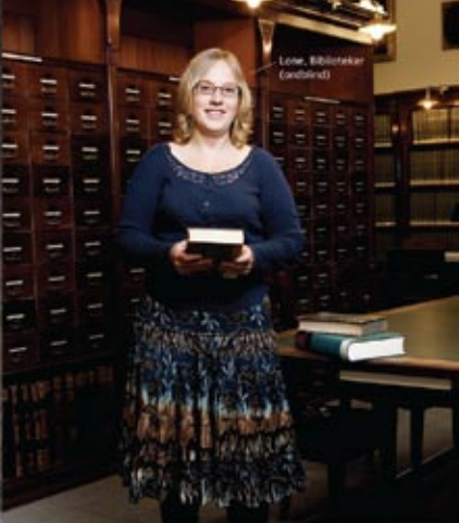
Lone, Biblioteker (Læsebånd)

Udnyt potentialet Tilmeld din virksomhed på potentialet.dk