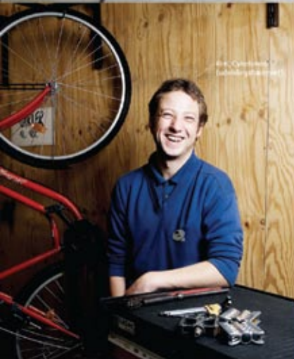
Per, Carlsberg (Lubrikationscenter)